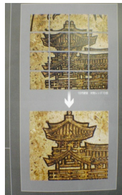
パッチワーク機能