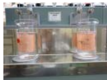
電解分析後 (陰極に銅析出)